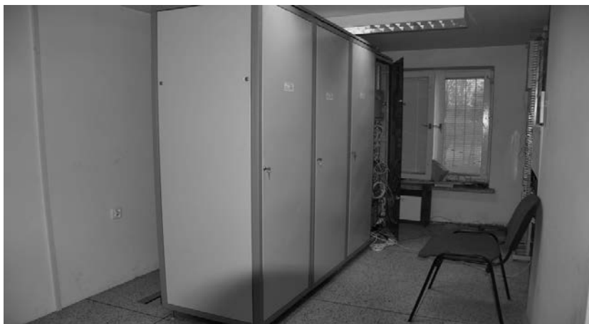
Centrala DGT 3450

Zdjęcia wykonano aparatem Canon D60 obiektyw NIKKOR DX G ED z filtrem UV Polaroida Multi-Coated.